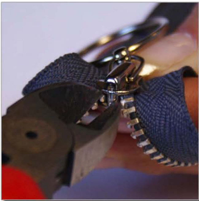
Knipa i toppen av löparen

Enklaste sättet att få bort den gamla löparen är genom att använda en avbitartång. Du kan både knipa och böja av löparen. (se bilderna)