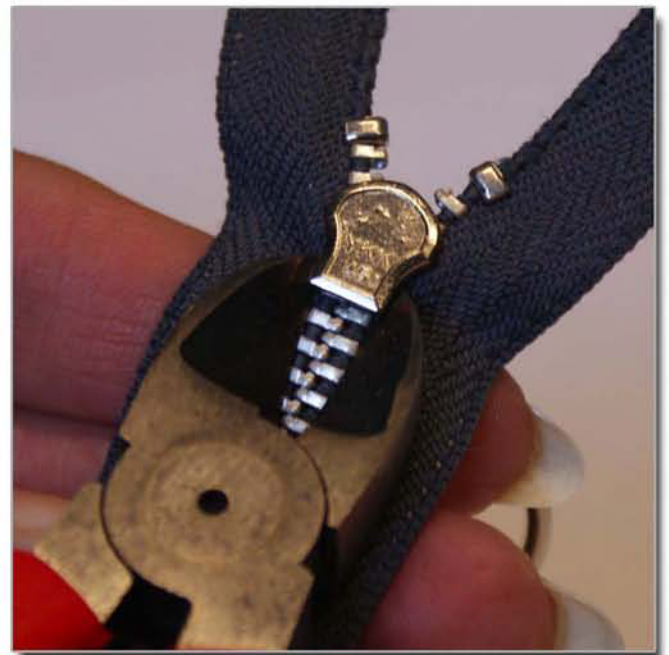
Böja i underkant av löparen